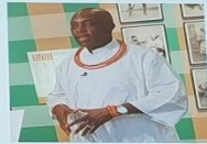
His Royal Highness Prince Aghaie Erediauwa